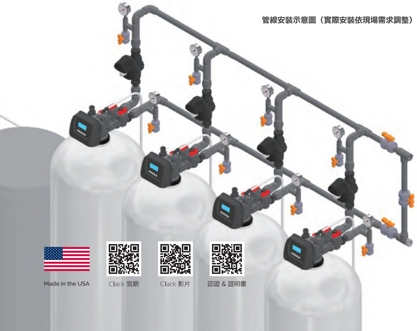
管線安裝示意圖 (實際安裝依現場需求調整)

軟水機建議選項：戶外硬殼保護蓋、前置雜質過濾器、KW8 食品級樹脂、ATS 軟化樹脂、ATS 軟化鹽錠